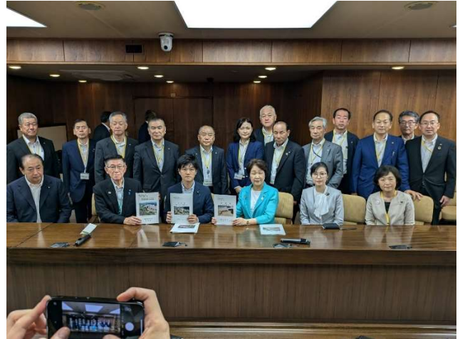
鈴木憲和農林水産副大臣