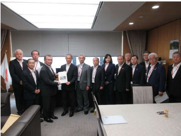
竹内芳明総務事務次官