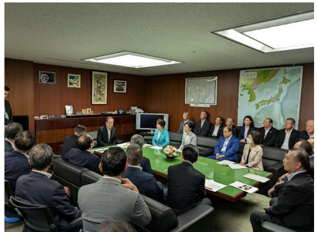
斉藤鉄夫国土交通大臣