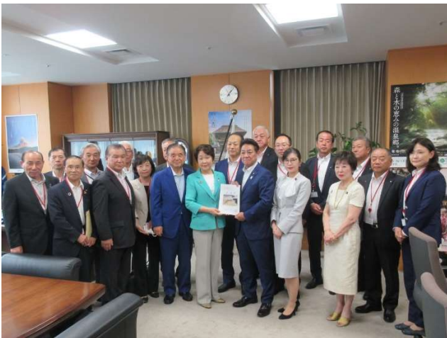
松村祥史防災大臣