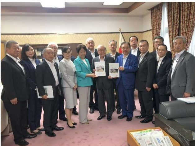
鈴木俊一財務大臣