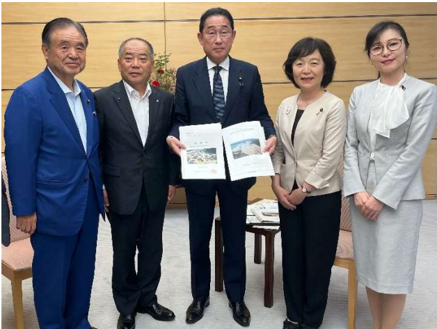
岸田文雄内閣総理大臣