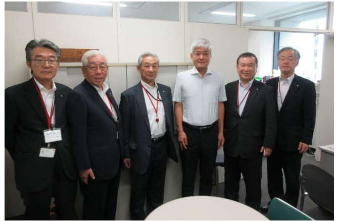
総務省 自治財政局 神門財政課長