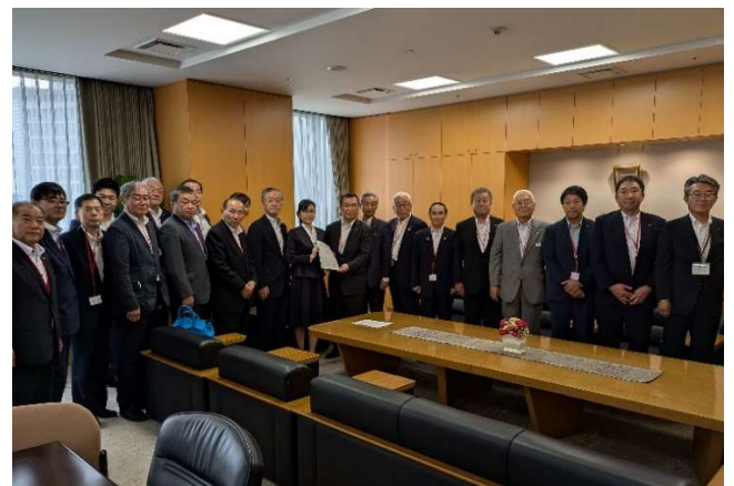
加藤鮎子内閣府特命担当大臣(こども家庭庁)