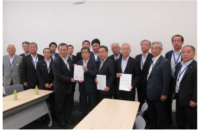
公明党 上田政務調査会長代理 ・若松謙維参議院議員・横山真一参議院議員