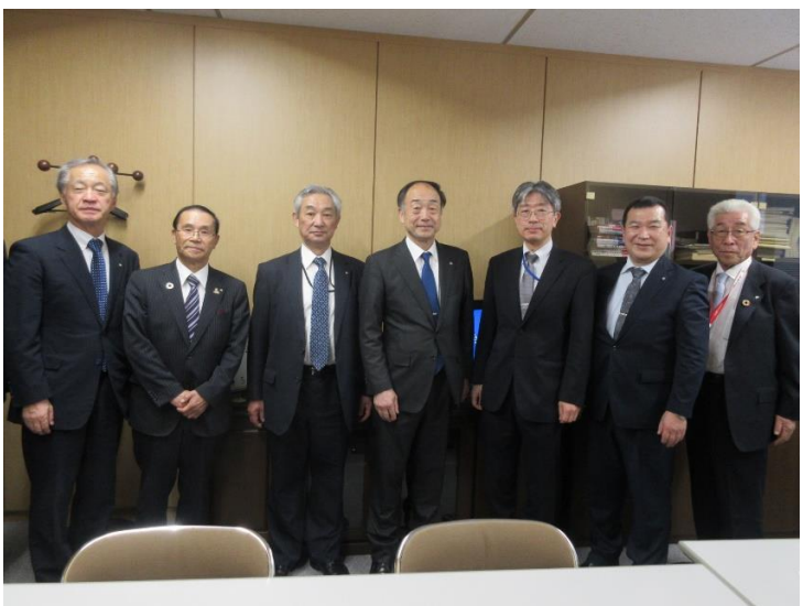
柴田行政改革推進本部次長