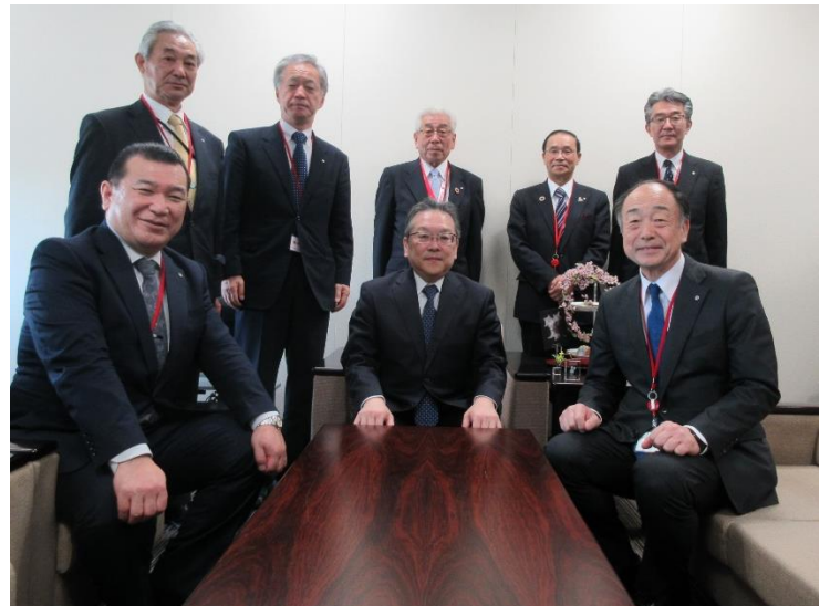
長橋内閣府内閣審議官