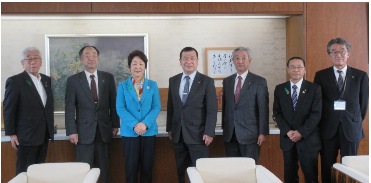
吉村美栄子山形県知事