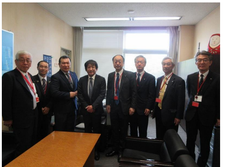
国土交通省 丹羽道路局長