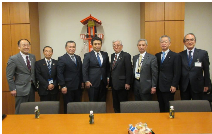
西田総務大臣政務官（中央左側）

2月15日、衆議院議員会館において西田昭二総務大臣政務官と本会正副会長、顧問が面談を行った。