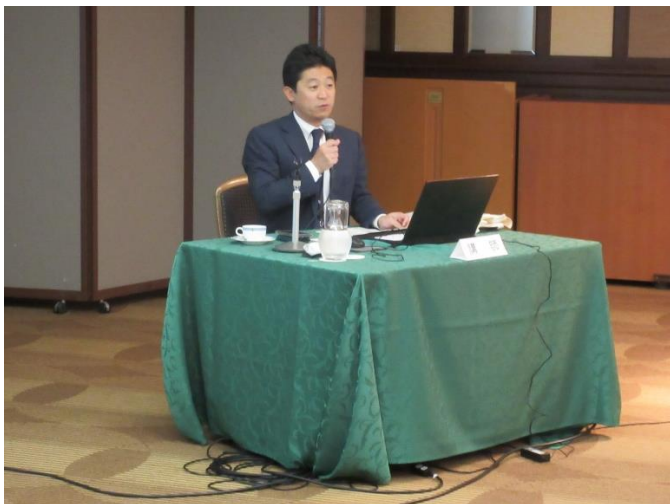
国土交通省 埴崎課長