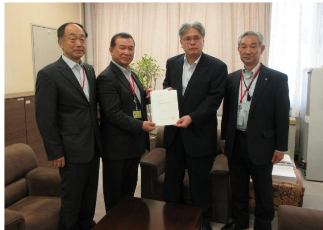
長井俊彦農林水産省農村振興局長