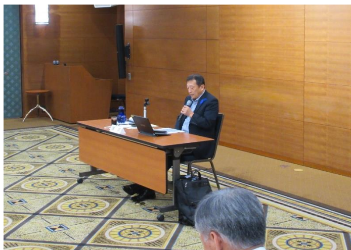
安彦広斉文部科学大臣官房審議官