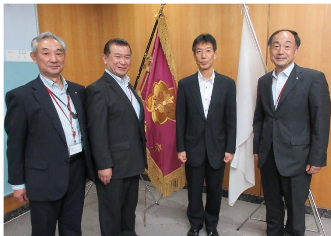
原邦彰消防庁長官