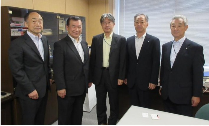
柴田智樹内閣官房行政改革推進本部次長