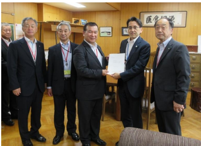
青山豊久林野庁長官