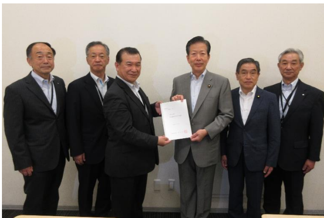
公明党山口那津男代表・若松謙維参議院議員