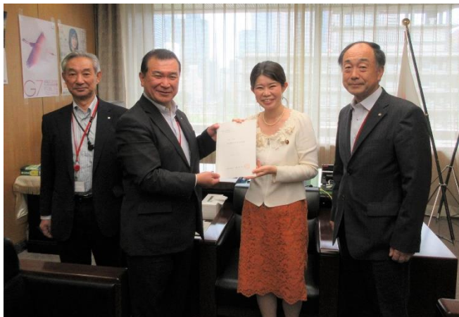
国光あやの総務政務官