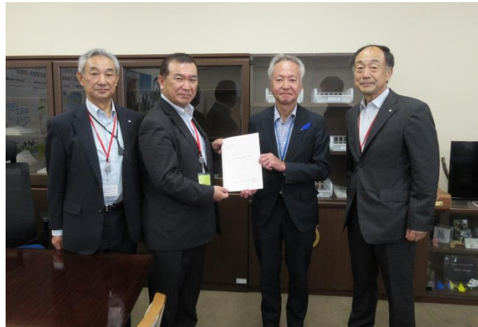
渡邊洋一農林水産省畜産局長