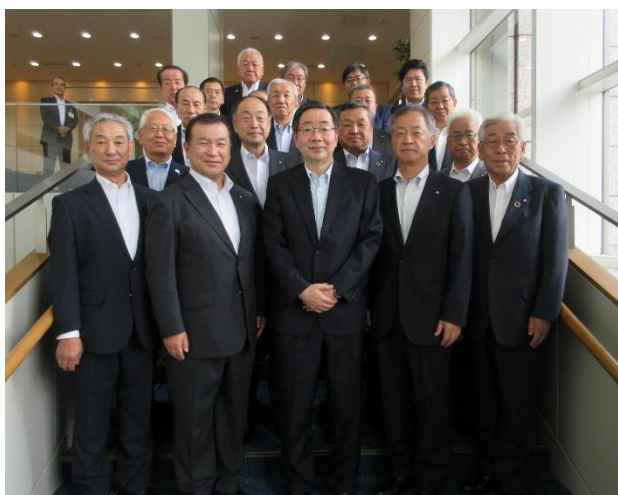
内藤尚志総務審議官

7月20日、全国町村会館において文部科学省幹部職員と本県町村長との意見交換会を開催した。文部科学省大臣官房審議官の安彦広斉氏を講師に招き、「小中学校教育を取り巻く現状と課題」について説明を受け、その後意見交換を行った。