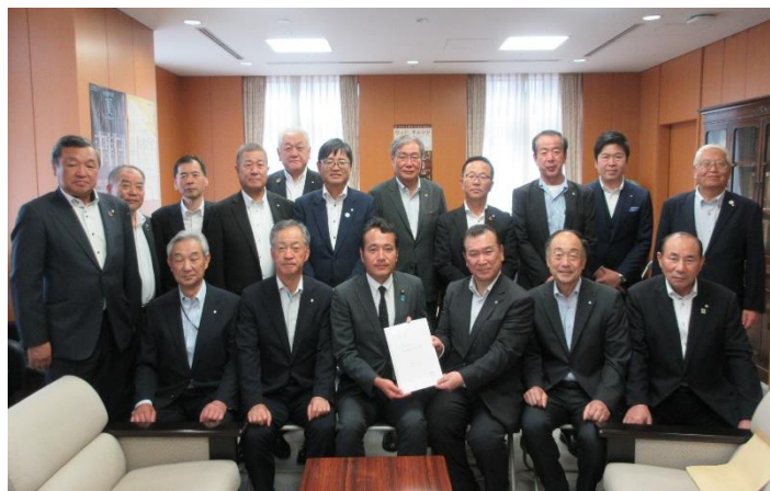
梁和生文部科学副大臣