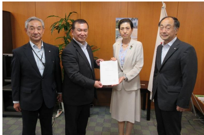
本田顕子厚生労働政務官