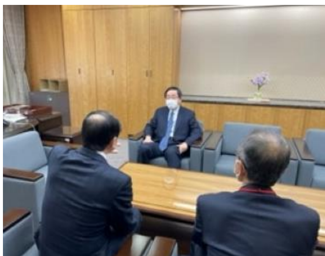
内藤尚志総務審議官