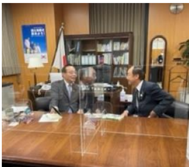
谷公一防災担当大臣

1月25日・26日、東京都内において、原田会長が谷公一防災担当大臣、小倉将信内閣府特命担当大臣、山下哲夫総務事務次官、内藤尚志総務審議官と面談を行った。